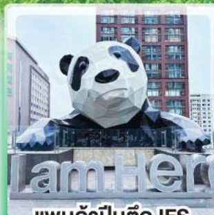
แพนด้าป็นตึก IFS