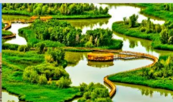
อุทยานพื้นที่ชุ่มน้ำจางเย่