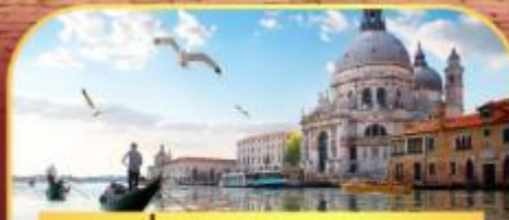
นั่งเรือสุทเกาะเวนิส