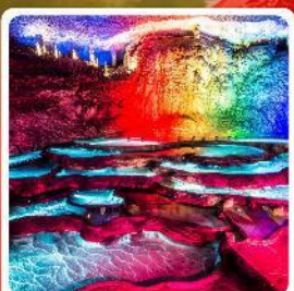
กำก้ำเทพ