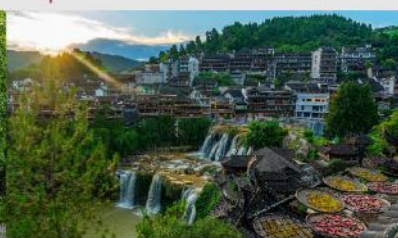
หมู่บ้านโบราณฝูหรงเจิ้น

*ทางบริษัทฯ ขอสงวนสิทธิ์ในการสลับโปรแกรมทัวร์ตามความเหมาะสมขึ้นอยู่กับสถานการณ์หน้างาน โดยคำนึงถึงผลประโยชน์ของลูกค้าเป็นสำคัญ