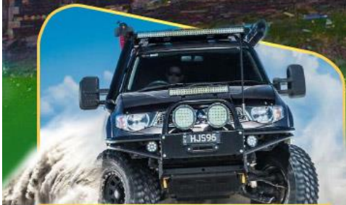
คันรถ 4WD สู้อีกกลางเทือกเขาคอเคซัส