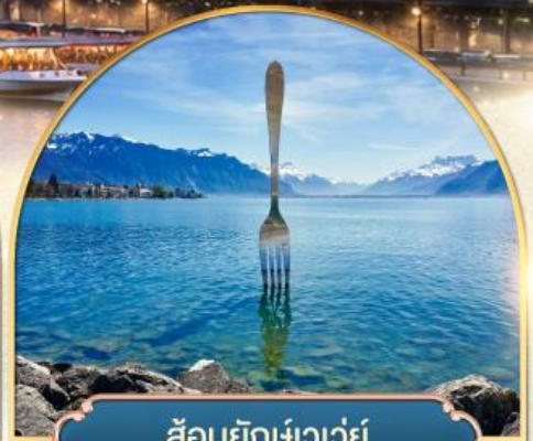
ส้อมยักเขาวัว