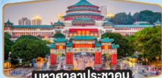
มหาศาลาประชาชน