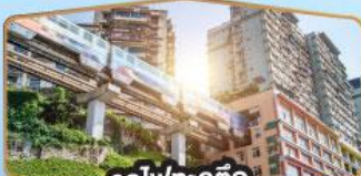
รถไฟฟ้า-สุตึก