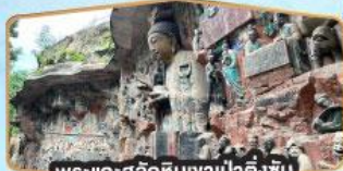
พระแกะสลักหินเจ้าป่าตั้งขึ้น