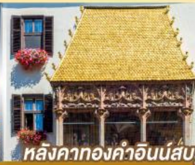
หลังคาทองคำอินน์ส์บรุค