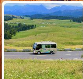
ทุ่งหญ้าเจียบจูลาเค่อ