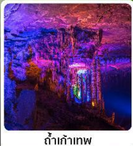
ถ้ำเก้าทง