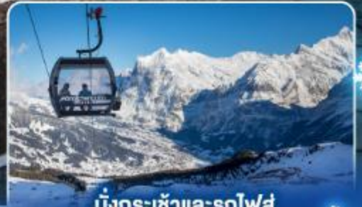
นั่งกระเช้าและรถไฟสุด อลเวงจากุงเฟรา