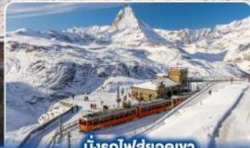
นั่งรถไฟสุดอลเวง กรอนเนอร์เกรต