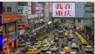
กวนอิมเจียว

*ทางบริษัทฯ ขอสงวนสิทธิ์ในการสลับโปรแกรมทัวร์ตามความเหมาะสมขึ้นอยู่กับสถานการณ์หน้างาน โดยคำนึงถึงผลประโยชน์ของลูกค้าเป็นสำคัญ