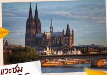
แวะชม มหาวิหารโคโลญ