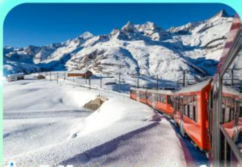
นั่งรถไฟสู่ยอดเขารอนเนอร์แตร

สวยสะท้านฟ้าที่สวิสฯ สะกดรักที่โดม พิชิตเขาแมทเทอร์ฮอร์นและจุงเฟรา