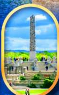
วิกเกอร์แลนด์