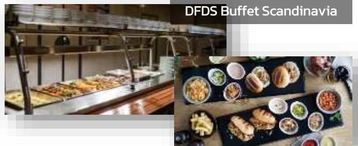
DFDS Buffet Scandinavia

ค่ำ บริการอาหารค่ำแบบบุฟเฟ่ต์ ณ ห้องอาหารของเรือ DFDS