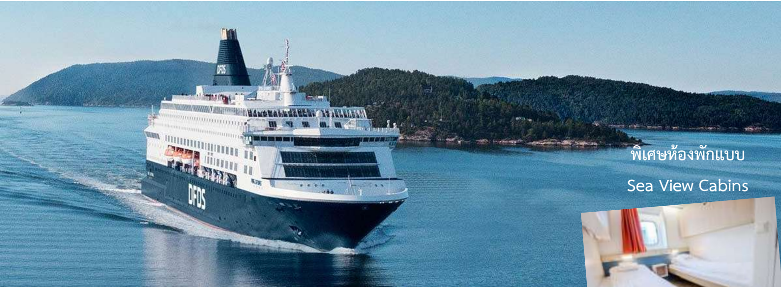
พิเศษห้องพักผ่อน Sea View Cabins