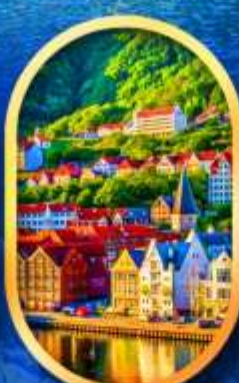
พิกเมืองเบอร์เก็น