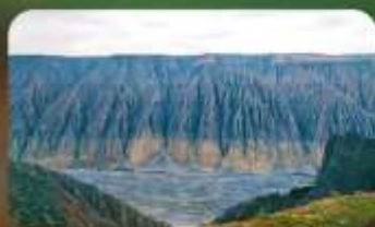
แกรนด์แคนยอนคูซานจื่อ