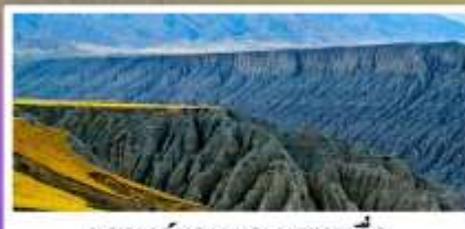
แกรนด์แคนยอนตูซานจื่อ