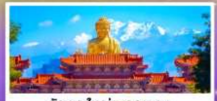
วัดพระใหญ่ทงกวงชาน