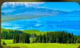
ทะเลสาบโซหลี่มู่