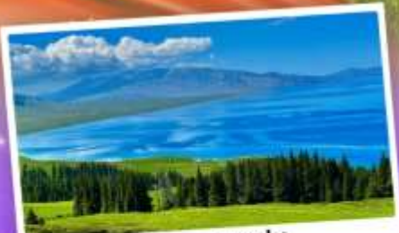
ทะเลสาบโซหลี่มู่

เที่ยวทุ่งหญ้าคอกฟ้า นาราตี ชมความสวยงามทะเลสาบโซหลี่มู่