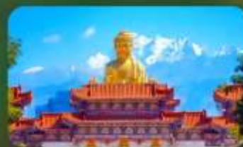
วัดพระใหญ่หรงกวงซาน