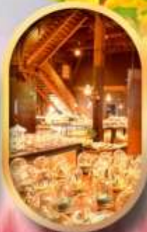
พพิธันท์กลองดนตรี