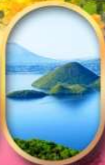
วิวทะเลสาบโทยะ