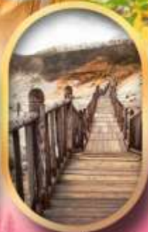
หุบเขาจโถกุดามิ