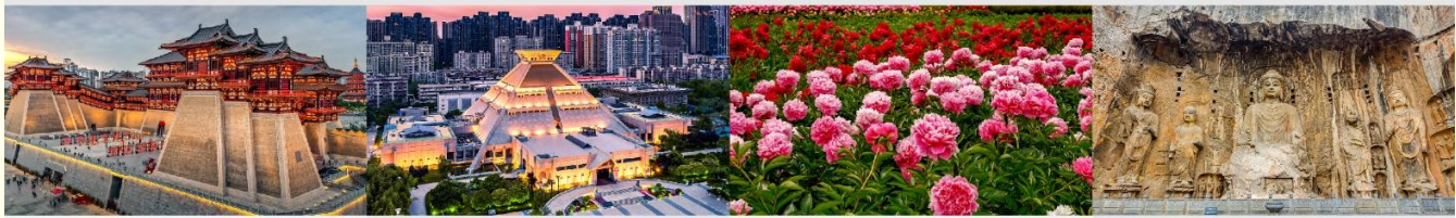
พิพิธภัณฑ์มณฑลเหอหนาน