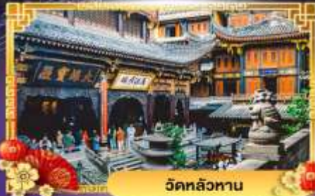
วัดหลัวหนาน