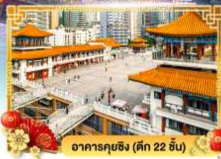
อาคารคุยซิง (ตึก 22 ชั้น)