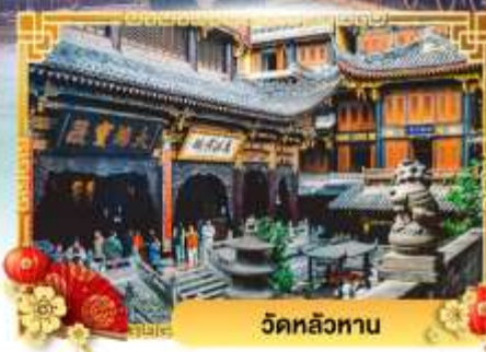
วัดหลิวทาน