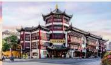
ตลาดร้อยปีเงินหวงเมี่ยว