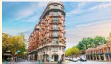
ถนนอู่คัง