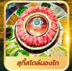
สุกีสโตล์มองโก