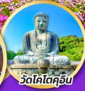
วัดโคโตคุอิน