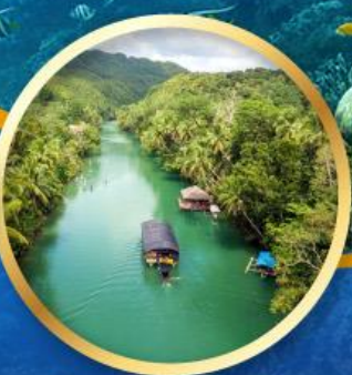
ล่องเรือแม่น้ำไลบ็อก