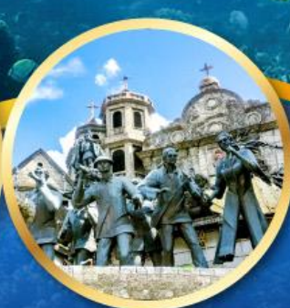
อนุสาวรีย์มรดกแห่งเซบู