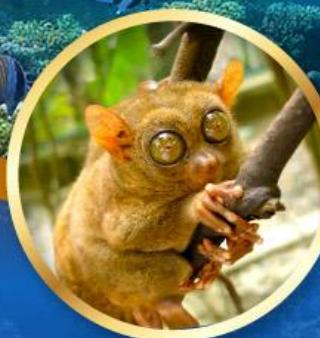
ลิงการ์เซีย