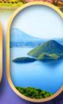
วิวทะเลสาบโทโย