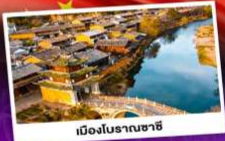
เมืองโบราณซาซี

ชมดอกไม้บานสะพรั่งทั่วยูนนาน "เซ็ดอี่แฉาเผ่ววิาศุดอี่ลิ่ง"