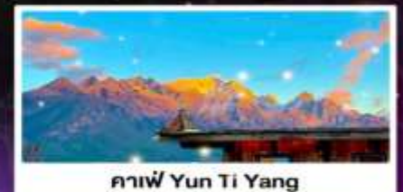
คาเฟ่ Yun Ti Yang