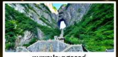
ทิวเขาประตูสวรรค์