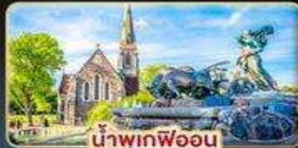
น้ำพุเกฟออน