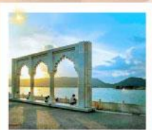
Ana Sagar Lake