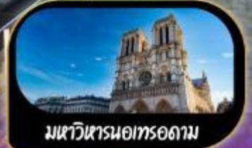
มหาวิหารนอทรอดาม