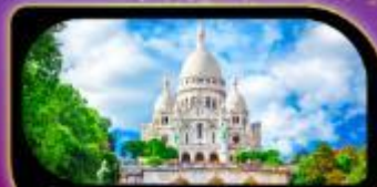
วิหารสากรเทอร์ มงมาร์ต