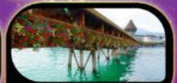
สะพานไม้ชาเปล ลูซิริน